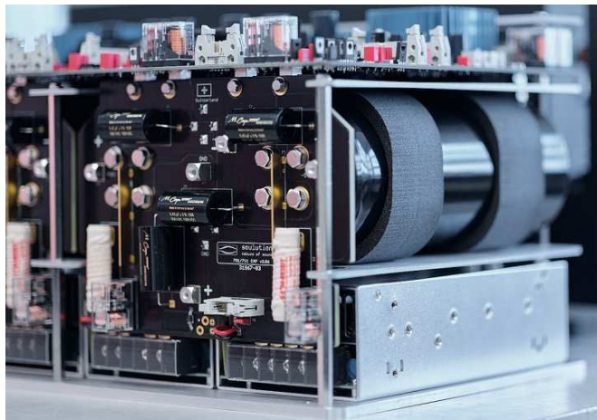
新設計のスイッチング電源部

従来モデル「710」との大きな違いの1つとして、「710」では1,000VA トロイダルトランス 2基を搭載したリニア電源を採用していたのに対し、「711」では同社のリファレンス・モノラル・パワーアンプ「701」と同じ 600VA スイッチング電源 4基を搭載した最新のハイエンド・スイッチング電源を採用。総容量が驚異の 1,000,000 \mu F を超える巨大な最高級のフィルター・コンデンサ群を搭載しており、従来のトランスを使用したリニア電源よりも数段優れた性能を発揮する特別な仕様となっております。大規模な出力電圧と出力電流を完全に安定化することが可能になったことで、パワーアンプとしての真価を最大限に発揮します。内部にも導電性の高い高品質な銅製プレートを使用することで、大量の電流を無駄なく完璧に伝送する事が可能となりました。